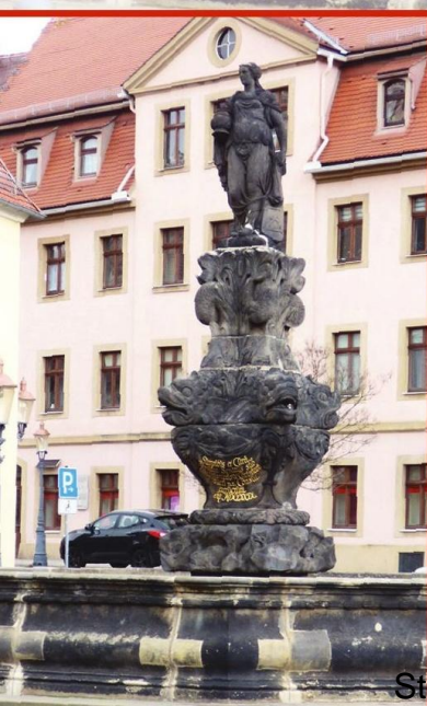
Hrádek nad Nisou